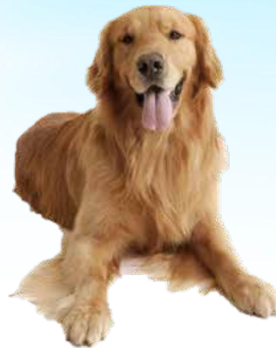
小狗都热得吐舌头